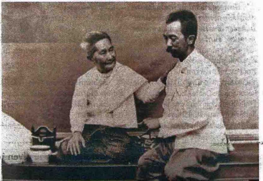
สมเด็จพระเจ้าบรมวงศ์เธอ กรมพระยาดำรงราชานุภาพ ทรงฉายร่วมกับเจ้าจอมมารดาชุ่ม