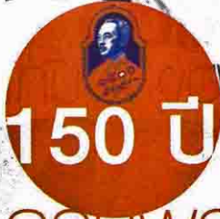
สมเด็จพระเจ้าบรมวงศ์เธอ กรมพระยาดำรงราชานุภาพ